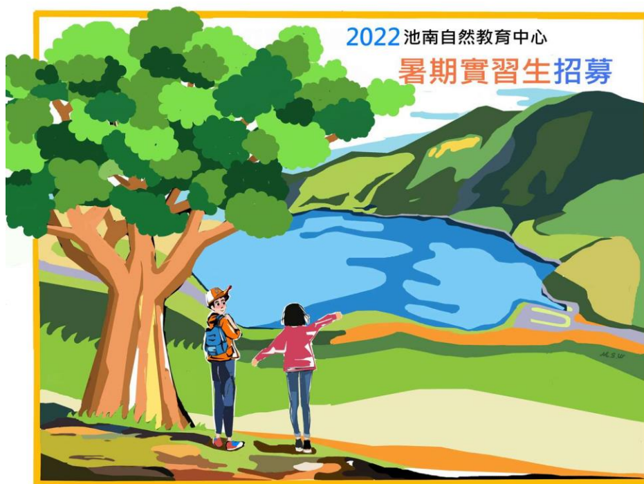
走入洄瀾時光森林，體驗低海拔山水之美，實踐友善環境生活

花蓮林區管理處為促進池南自然教育中心與大專院校學術機構合作，開創青年學子一個嶄新的學習環境，藉由理論與實務結合之培訓課程，提供學生參與環境教育及志願服務管道，以培育未來環境教育專業從業人員為目標，特訂定本計畫